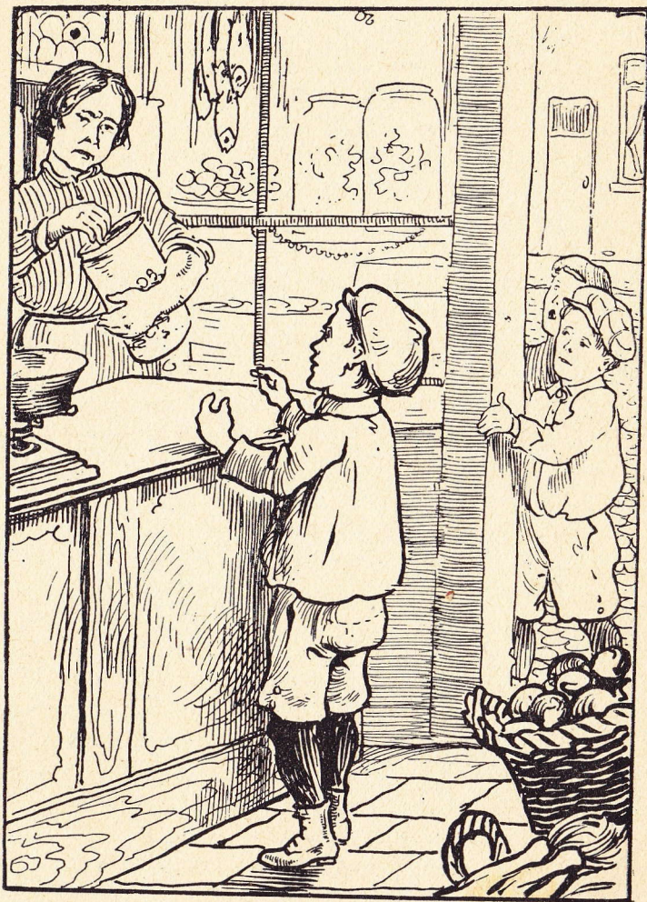
Geef me een bol.